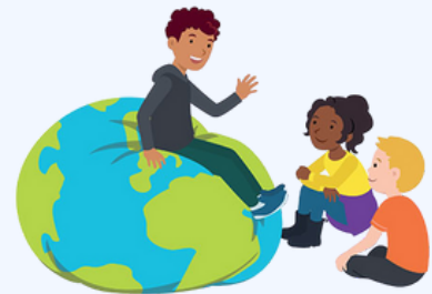
We hebben oor voor elkaar

Hierbij gaat het om het verdedigen van een stelling, bijvoorbeeld 'kinderen moeten op tijd naar bed' of 'iemand die pest moet streng gestraft worden'. In groep 8 leren de kinderen over cyberpesten en wat ze kunnen doen. Ze leren over verschillen in communiceren via sociale media en face-to-face.