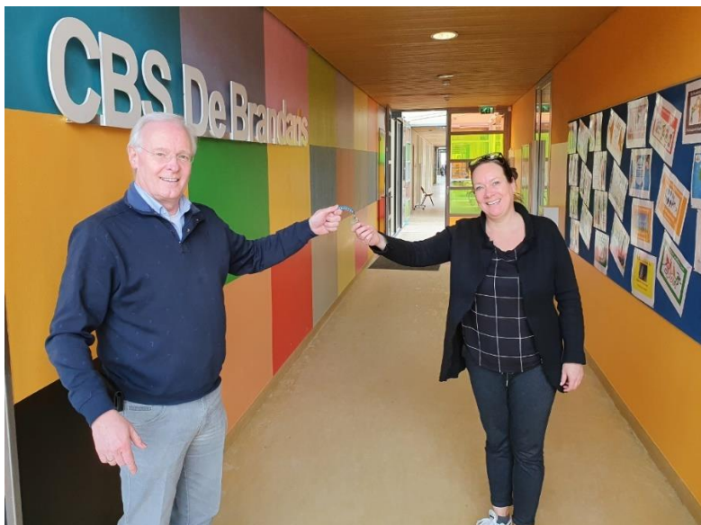
De officiële sleuteloverdracht!

De sleuteloverdracht heeft inmiddels plaatsgevonden. Zie foto.