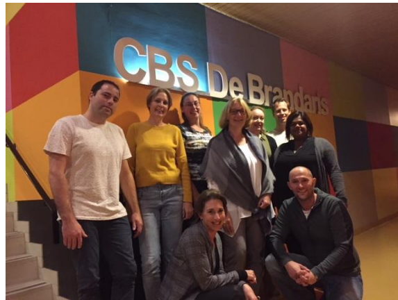
2019-2020; update volgt